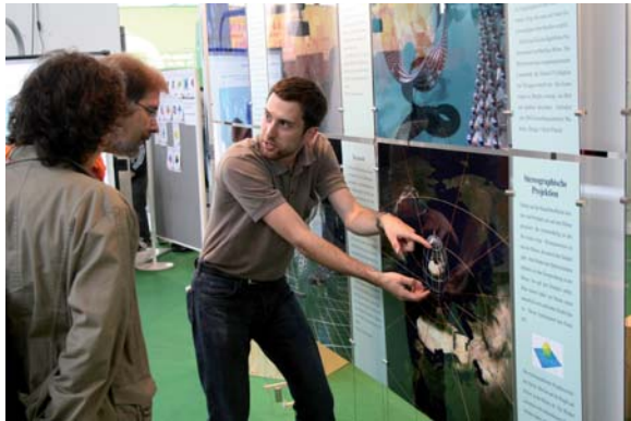
Individuelle Erklärungen eines IMAGINARY-Betreuers bei der Ausstellung in Stuttgart

lernbegierig. Und Menschen wollen die Programme auch selbst ausprobieren und mit nach Hause nehmen.