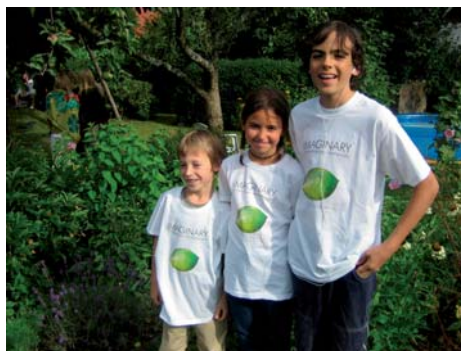
Nachwuchs-MathematikerInnen freuen sich schon auf weitere Aktionen rund um die Ausstellung.