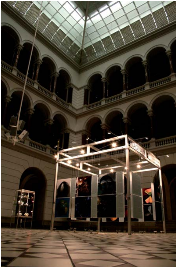
IMAGINARY als Blickfang im Lichthof der TU Berlin

Das Mathematische Forschungsinstitut Oberwolfach konzipierte gemeinsam mit Mathematikern aus Deutschland, Österreich, Belgien, Frankreich, den USA und Kanada die interaktive Wanderausstellung IMAGINARY, die im Jahr der Mathematik 2008 in 14 deutschen Städten und bei vielen Sonderaktionen zu sehen war. In diesem Artikel möchten wir Hintergründe der Ausstellung beleuchten, Erfahrungen im Jahr der Mathematik teilen und einen Ausblick auf die zukünftige Planung geben.