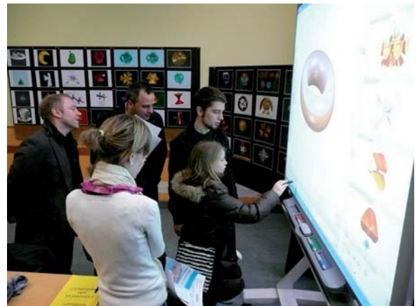
Eine eigene „IMAGINARY“-Ausstellung, selbst organisiert vom Otto-Hahn-Gymnasium in Saarbrücken

Die Nachfrage nach einer Vermittlung der Inhalte der Ausstellung auch für ein Fachpublikum war groß. Bei dem Mini-Symposium „IMAGINARY – Techniken aus der Visualisierung in der Geometrie“ der DMV-Tagung in Erlangen wurden die Techniken und mathematische Ideen