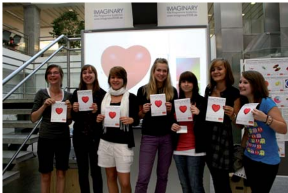
Schulklasse in Kassel: „Ein Herz für die algebraische Geometrie!“

Die interaktiven Programme der Ausstellung regen zum spielerischen Umgang mit der Geometrie an. Besonders beliebt war das Programm SURFER, das zusammen mit MitarbeiterInnen aus Kaiserslautern speziell für die Ausstellung entwickelt wurde. Es erlaubt, Formeln und Figuren selbst zu erfinden oder bereits vorhandene Formeln kreativ zu verändern. Es war überraschend zu beobachten, wie viel Spaß dies macht und wie man nach einiger Zeit und etwas Überlegung zu verstehen beginnt, welche Rolle die dahinterliegende Mathematik spielt.